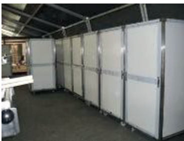
Chambre de pousse / Rising area

Big unit fitted on 5 4x4 trucks with 20' containers. Towable generator. Setting up: 6h. Output per day in crisis situation: 80,000 individual loaves 24/7