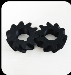
Matière Nylon Carbone PA6-CF Avec éjection automatique