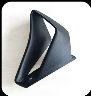
Matière PETG Carbone Impression en 10 heures